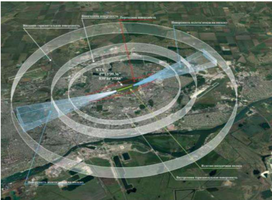
Таблица 4.1. и 4.2. НГЭА ЭА (Таблица №23)